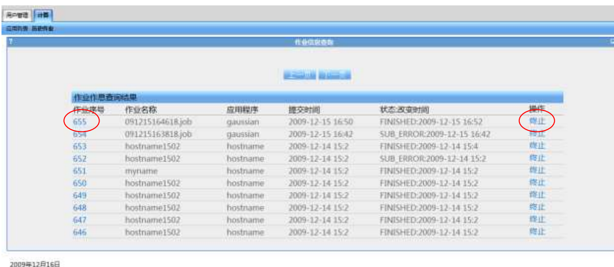
图 4 作业信息查询