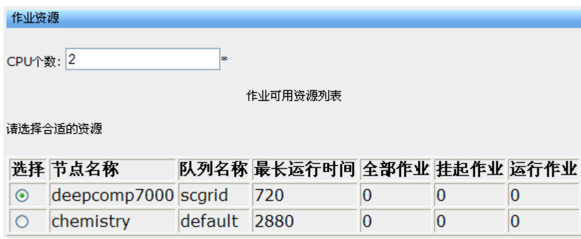
图 3 作业可用的资源